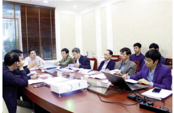
Quang cảnh cuộc họp

Trong quá trình thực hiện đề tài, nhóm nghiên cứu đã thu thập thông tin, tài liệu liên quan đến