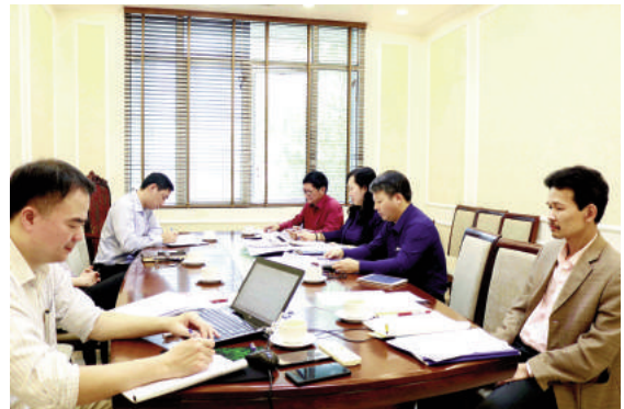
Toàn cảnh cuộc họp

Để thực hiện nhiệm vụ được giao, nhóm nghiên cứu đã tiến hành nghiên cứu tổng quan,