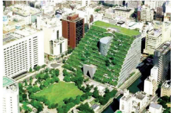
Vườn trên mái của Bảo tàng Nghệ thuật đương đại (Manhattan, New York, Mỹ) tâm lịch sử có mật độ xây dựng cao.

- Nguyên tắc giảm khối lượng xây dựng mới: Có thể được áp dụng khi tái thiết các công trình cũ và giải quyết vấn đề phủ xanh tại các trung